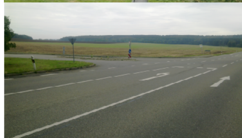
L 380 Einfahrt zum Gutshof von Reutlingen