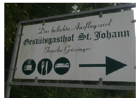
L 380 aus Richtung St. Johann

Ansicht Treffpunkt Waldparkplatz . Bitte nur hier parken!